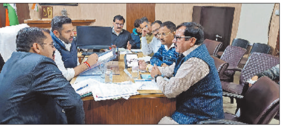
सोनीपत। बैठक करते मेयर, कमेटी उपाध्यक्ष, निगम आयुक्त एवं अन्य।

नगर निगम सोनीपत के क्षेत्र में आने वाले विभिन्न कॉलोनियों में विकास कार्यो के लिए 9 करोड़ 52 लाख 9 हजार रुपये की राशि मंजूर की गई है। ये राशि बुधवार को नगर निगम में आयोजित वित्त एवं अनुबंध कमेटी की बैठक में तय की गई। इस राशि से 5 वार्डों में विकास कार्य करवाए जाएंगे, जिसमें सड़कों पर एलईडी स्ट्रीट लाइट, पुरानी स्ट्रीट लाइटों की मरम्मत करने, पार्कों का सौंदर्यकरण आदि प्रमुख रूप से शामिल है। इन सभी विकास कार्यो के लिये बजट मंजूर करते जल्द ही