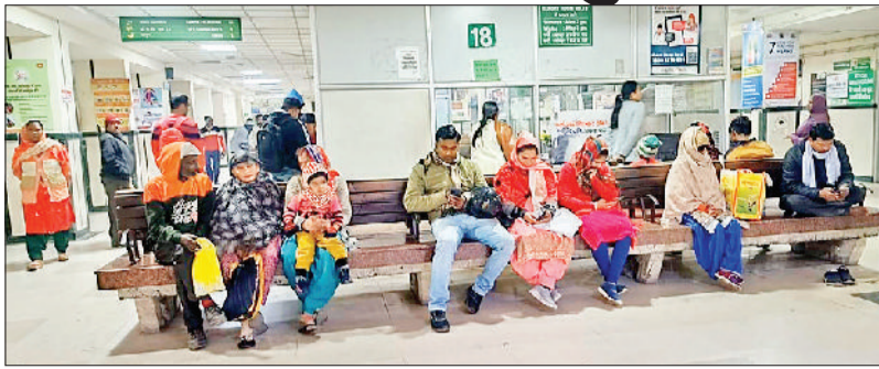
सोनीपत। ओपीडी खुलने का इंतजार करते हुए मरीज।