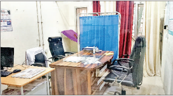
सोनीपत। ओपीडी में खाली पड़ी चिकित्सकों की कुर्सियां।