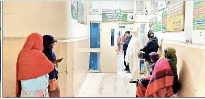
सोनीपत। आपातकालीन कक्ष में बैठे मरीज व जानकारी देते हुए युवक व बुजुर्ग।

हरिभूमि न्यूज ▶▶ सोनीपत सरकारी चिकित्सकों की हड़ताल के चलते जिला नागरिक अस्पताल, सीएचसी व पीएचसी में ओपीडी बंद रही। सरकारी अस्पतालों के 37 चिकित्सकों ने हड़ताल रखी, इनमें जिला अस्पताल के 20 चिकित्सक शामिल रहे। अस्पतालों में मरीज इलाज के लिए ओपीडी खुलने का इंतजार करते रहे, लेकिन कोई राहत नहीं मिली। जिसके चलते उन्हें इलाज कराए बिना वापस लौटने को मजबूर होना पड़ा। विभाग के पास 159 एमबीबीएस चिकित्सक हैं। मरीजों की सुविधा के लिए