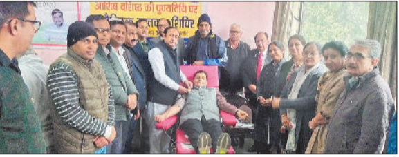
सोनीपत। रक्तदान शिविर में रक्तदाताओं का हींसला बढ़ते विधायक साथ में अन्य।