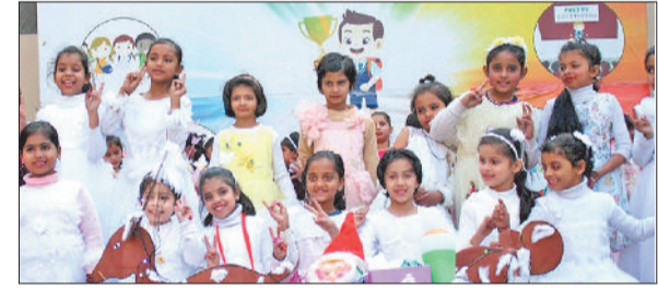
राई। ओम शांति स्कूल में क्रिसमस व वीर बाल दिवस पर कार्यक्रम के दौरान छात्र।